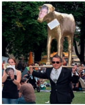
Aktion auf dem OpenOhr 2011 zu Spekulationsgeschäften

eigenen Agrarflächen meist für einige wenige Exportgüter dienen. Der französische Präsident und momentane G20-Vorsitzende Nicolas Sarkozy drängt auf eine stärkere Regulierung der Rohstoffmärkte , um Höhen und Schwankungen bei Nahrungsmitteln zu bekämpfen. Allerdings besteht die Sorge, dass einige Regierungen, u.a. Großbritannien, die Reformen der EU und G20 aufgrund massiver Opposition ihrer heimischen Bankenlobby blockieren